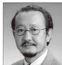
寺西 邦彦 先生 欠損補綴へのCBCTとレーザー活用術